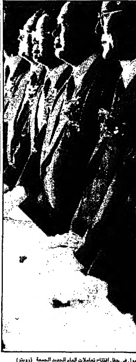
مؤيد بورصة سيول في حفل افتتاح تعاملات العام الجديد الجمعة

هبوط أسعار الذهب بوقت يفترض فيه ارتفاعها لندن - القدس العربي: وصل الذهب هبوطاً الجمعة وهبطت أسعاره إلى أدنى مستوياتها منذ حوالي 39 شهراً وسط تشاؤم في أوساط المتعاملين بإمكانية عودة المعدن الثمين إلى الصعود مجدداً. وسجل سعر الأوقية (الأونصة) في سوق لندن الدولية للمعادن 364 دولاراً في بداية جلسة القطع المسائية قبل أن يهبط لاحقاً إلى 361,80 دولاراً بفعل موجة بيع، لكنه استعاد بعض خسائره ليقتل على سعر 364,30 دولاراً. وكان الذهب أعلى العام الماضي عند مستوى 368 دولاراً، وجاء هبوط الذهب متضرراً مع ازدياد الخوف من التضخم بالاقتماد الأمريكي. فبدلاً من أن يؤدي ذلك إلى اندفاع المستثمرين لشراء الذهب خوفاً من التضخم الذي يقض مضيق القيمة الحقيقية للتقود، اندفع المستثمرون إلى البيع مما أدى إلى هبوط أسعار المعدن الثمين. وقسر متعاملون ذلك بانخفاض صناديق الاستثمار التي تسجل أرباحها من الذهب لخطة مركزها المشكوفة في أسواق الأسهم والسندات، غير أن مثل هذا التفسير لم يلق قبولاً إجماعياً.